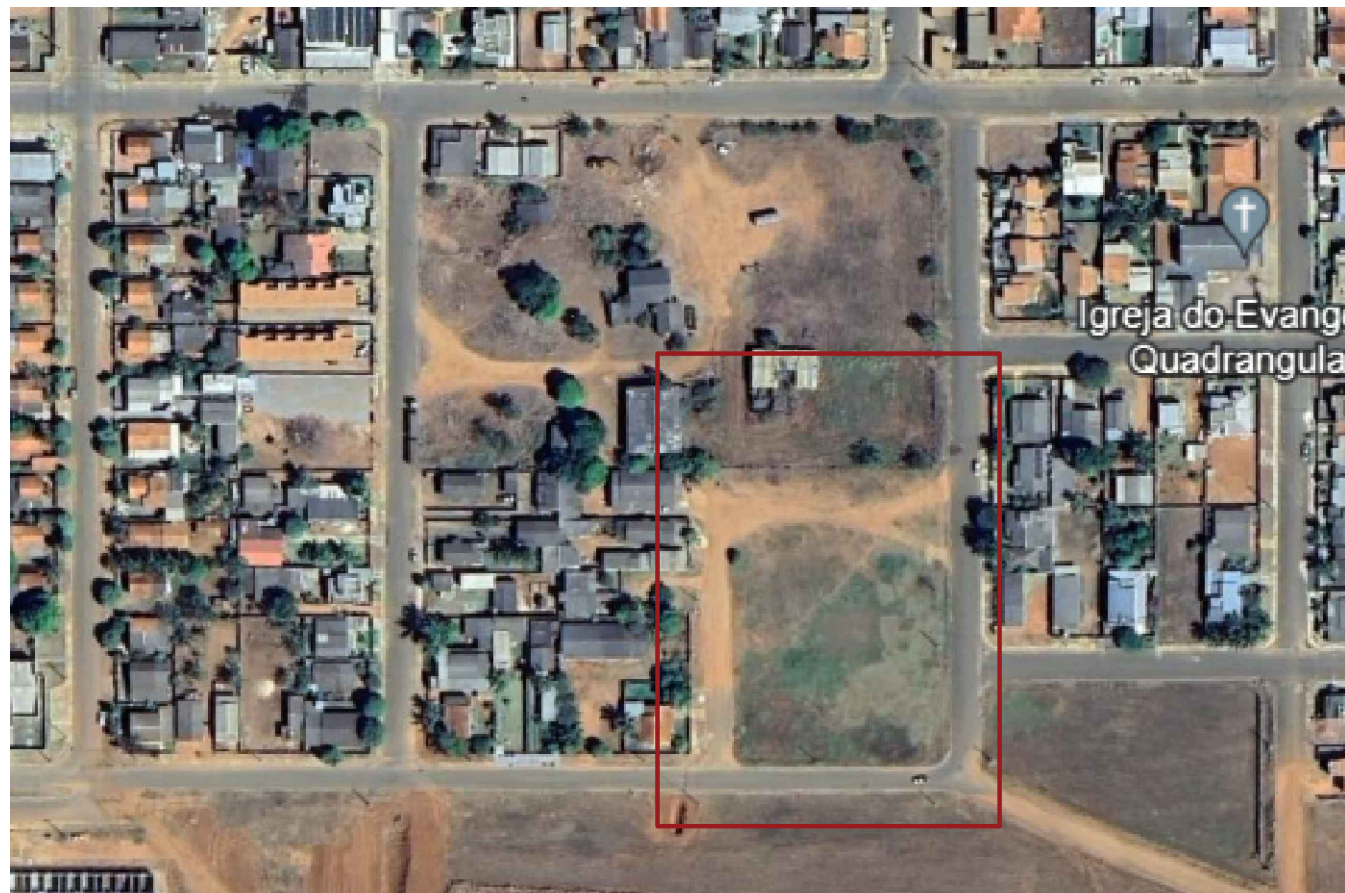
MAPA DA ÁREA - GOOGLE EARTH